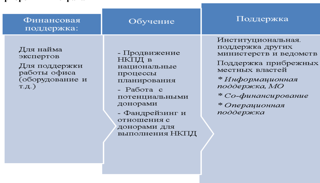
Рисунок 2. Поддержка, необходимая для успешного выполнения НПДК Каспийскими прибрежными странами