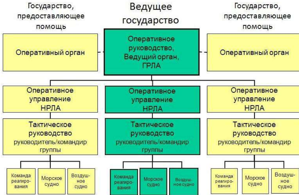
Схема 1: СТРУКТУРА РУКОВОДСТВА