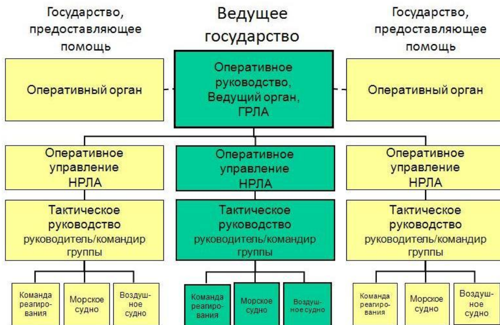
Схема 2: Виды связи